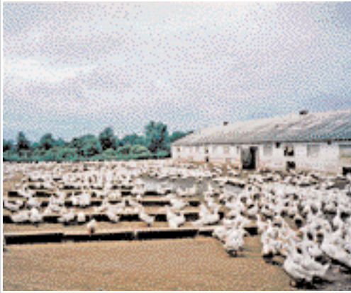
У планах ВАТ – збільшити поголів'я птиці