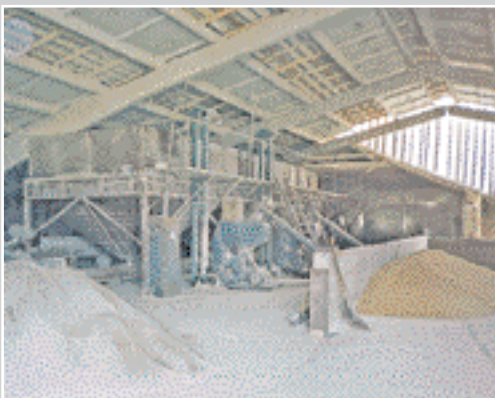
На комбікормовому заводі ВАТ