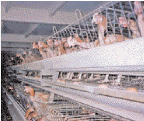
Ці курки «годуєть» дієтичним продуктом п'ять районів Сумщини