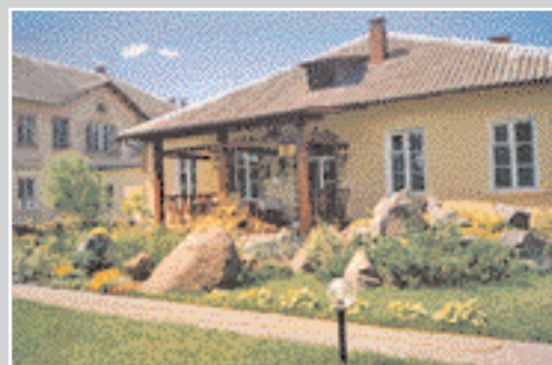
Ландшафтний дизайн двору перед центральним офісом ТОВ «ПЛЮС» ЛТД