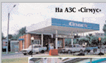
На АЗС «Сігмус»