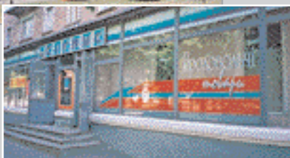
Магазин продовольчих товарів