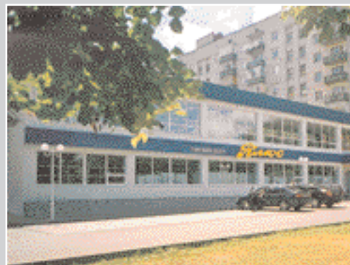
Торговий центр «ПЛЮС»